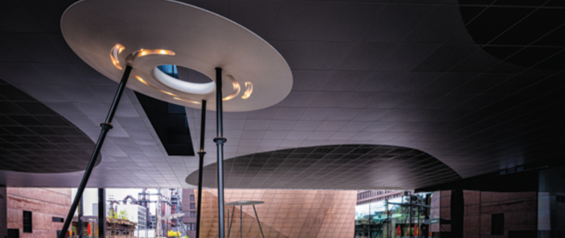
Campus de Belval