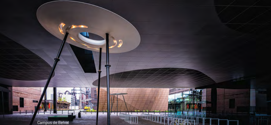
Campus de Belval