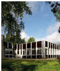
Campus de Kirchberg