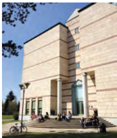
Campus de Limpertsberg

Le Campus de Kirchberg se trouve au cœur du quartier des affaires de la ville de Luxembourg, de la place financière internationale et à proximité des institutions européennes. Les espaces commerciaux du Kirchberg, la Coque (salles multisports et piscine olympique), le Musée d'Art Moderne Grand-Duc Jean (Mudam) ainsi que la Philharmonie du Luxembourg se situent à quelques mètres du site universitaire.