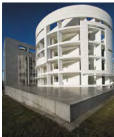
Campus de Kirchberg, bâtiment Weicker